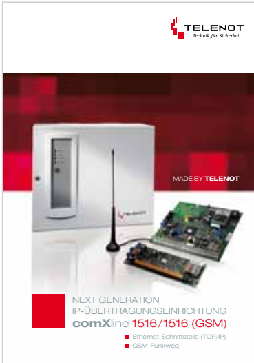
Prospekt „comXline 1516/1516 (GSM)“