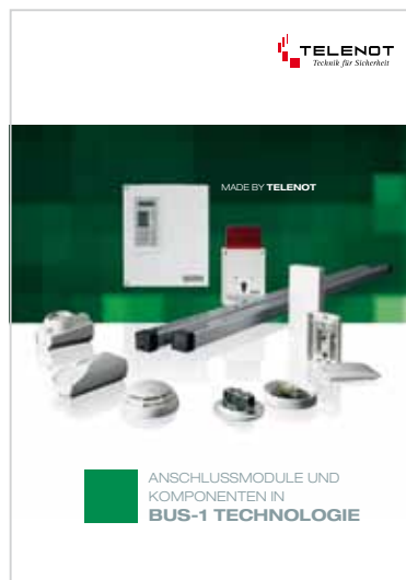
Prospekt „BUS-1 Module“