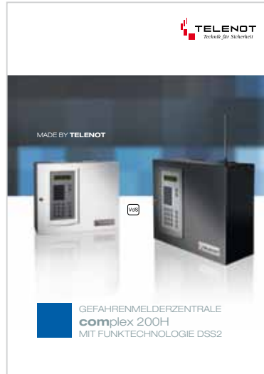
Prospekt „complex 200H“